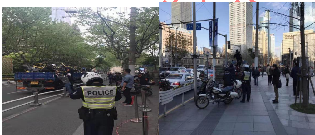
图 1 J 街道民警配合整顿非机动车违停

在非机动车违停治理过程中，管理办负总责，由街道交警、城管、网格中心以及居民小区协助，通过创新社会治理机制，实施巡察联动、执法联动，形成了管理办牵头、多部门联合的治理格局。如图 1 所示。