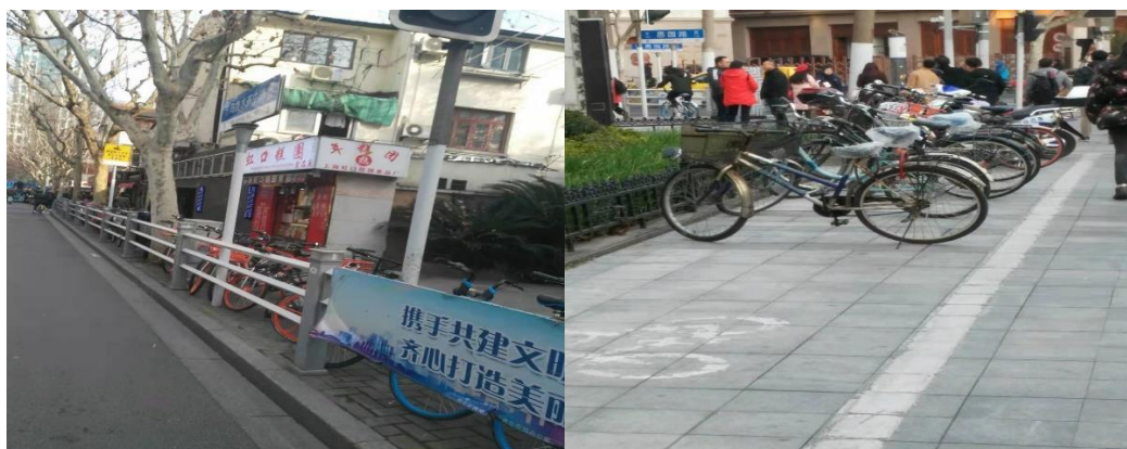
图 3 J 街道非机动车违停治理效果图

经过近两年的努力，J 街道的非机动车违停治理已取得阶段性成果，而且该项工作已经日常化和制度化了（见图 3）。