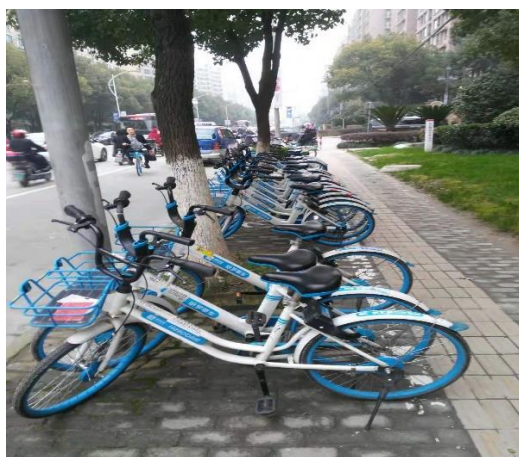
图 4 Z 街道非机动车违停治理效果图

Z 街道非机动车违停治理虽然取得了一定的效果（见下页图 4），但是如何建立长效机制，从被动式管理向主动“自觉”转变。这还需要 Z 街道继续探索。